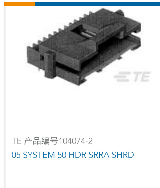
TE 产品编号104074-2 05 SYSTEM 50 HDR SRRA SHRD