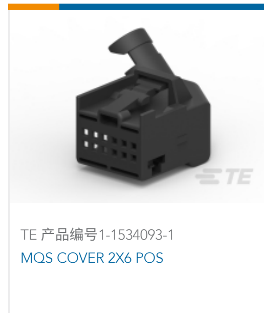
TE 产品编号1-1534093-1 MQS COVER 2X6 POS