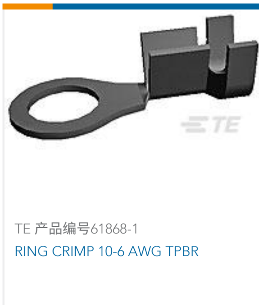
TE 产品编号61868-1 RING CRIMP 10-6 AWG TPBR