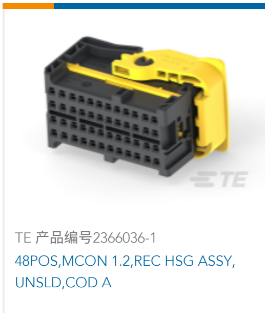
TE 产品编号2366036-1 48POS,MCON 1.2,REC HSG ASSY, UNSLD,COD A