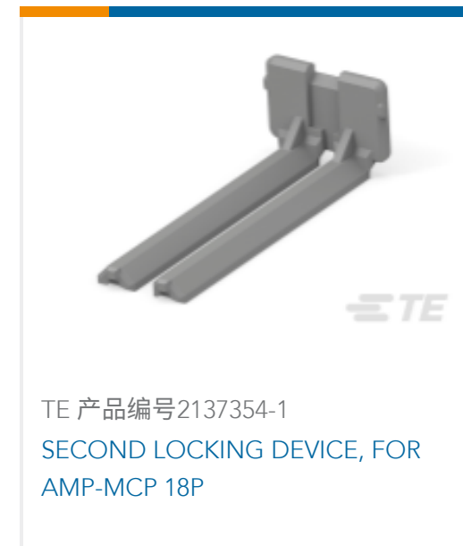
TE 产品编号2137354-1 SECOND LOCKING DEVICE, FOR AMP-MCP 18P