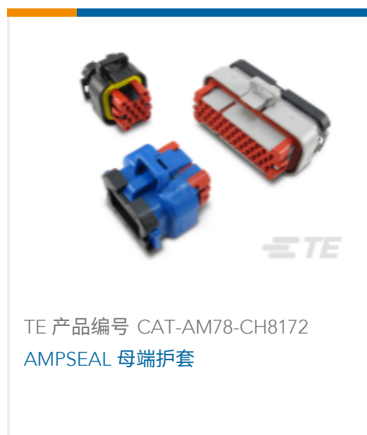
TE 产品编号 CAT-AM78-CH8172 AMPSEAL 母端护套