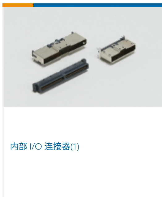
内部 I/O 连接器(1)