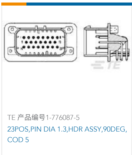
TE 产品编号1-776087-5 23POS,PIN DIA 1.3,HDR ASSY,90DEG, COD 5