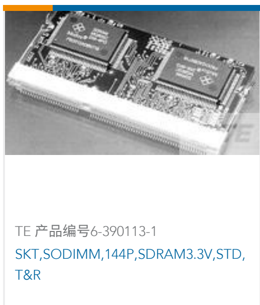
TE 产品编号6-390113-1 SKT,SODIMM,144P,SDRAM3.3V,STD, T&R