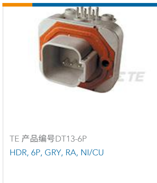
TE 产品编号DT13-6P HDR, 6P, GRY, RA, NI/CU