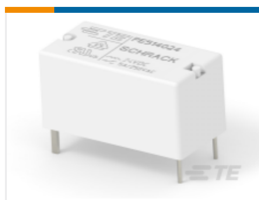
TE 产品编号2-1393219-2 PE514024