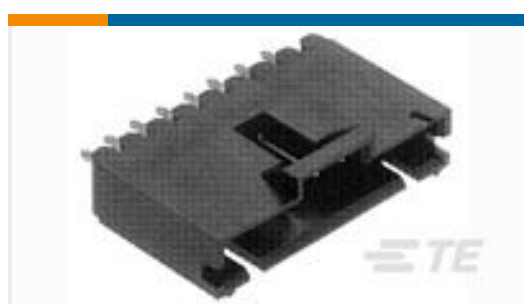
TE 产品编号103669-3 04 MTE HDR SRST LATCH W/HLDWN