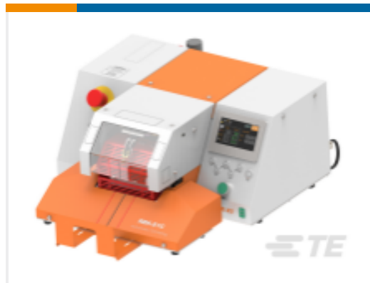
TE 产品编号 1-2376800-3 RBK-X1C, W/ AIR COOLING