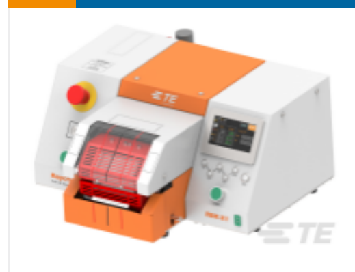
TE 产品编号 1-2234800-3 RBK-X1, W/ AIR COOLING