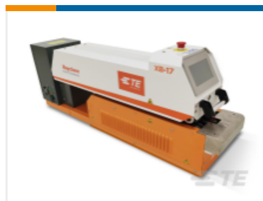
TE 产品编号 2375310-2 XB17 Belt Heater, 110V