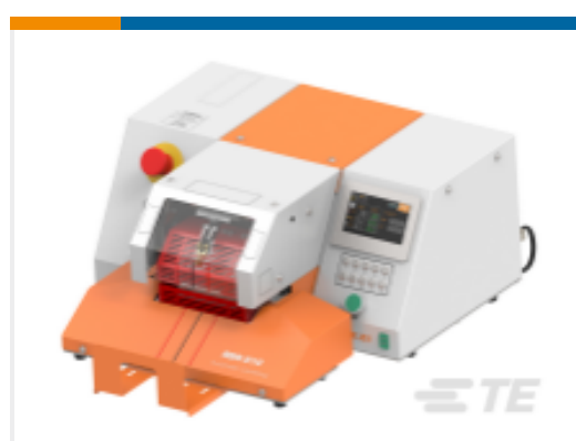
TE 产品编号 2376800-1 RBK-X1C STD