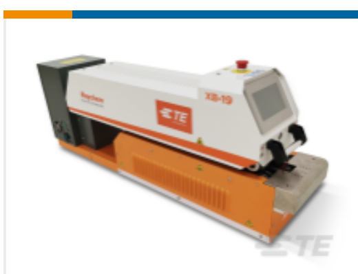
TE 产品编号 2375320-1 XB19 Belt Heater, STD