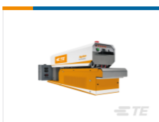
TE 产品编号 714529-000 CLTEQ-M19-BELT-HTR