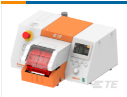
TE 产品编号 1-2234800-4 RBK-X1 CE, W/ AIR COOLING