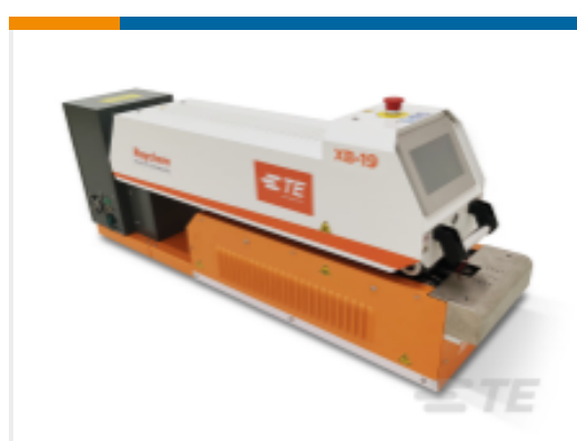
TE 产品编号 2375320-2 XB19 Belt Heater, 150mm (6") Version