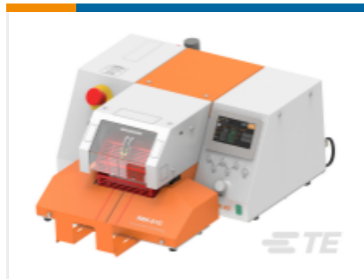
TE 产品编号 1-2376800-4 RBK-X1C CE, W/ AIR COOLING