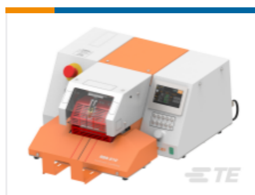
TE 产品编号 2376800-2 RBK-X1C CE STD