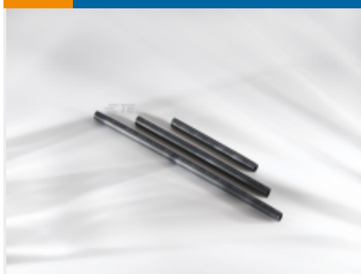
TE 产品编号206247P036 SCT 热缩管