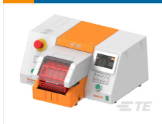
TE 产品编号 1-2234800-1 RBK-X1, AUTO TRIGGER