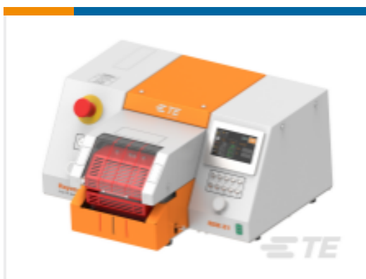
TE 产品编号 2234800-2 RBK-X1 CE STD