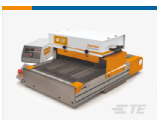
TE 产品编号 955018-000 CLTEQ-M105-TUNNEL-OVEN