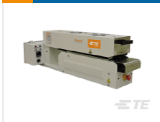
TE 产品编号 2280355-1 220 V MODEL 17