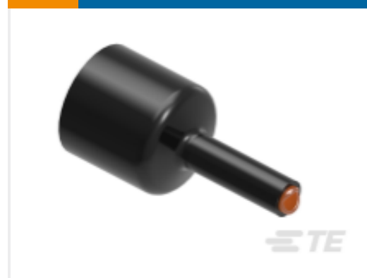
TE 产品编号581913P005 QS1500 热缩管