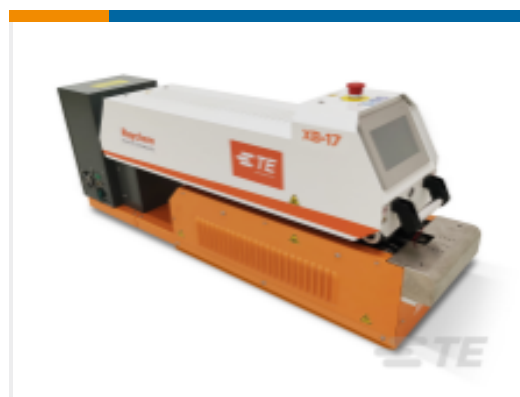
TE 产品编号 2375310-1 XB17 Belt Heater, 220V