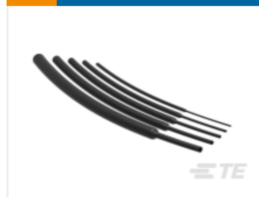
TE 产品编号E05774-000 VERSAFIT-1/4-0-25MM