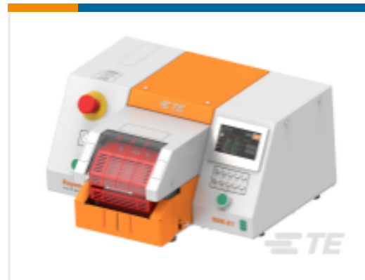
TE 产品编号 2234800-1 RBK-X1 STD