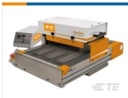
TE 产品编号 2326489-1 MODEL 105 TUNNEL OVEN, 36" ENTRY, STAND