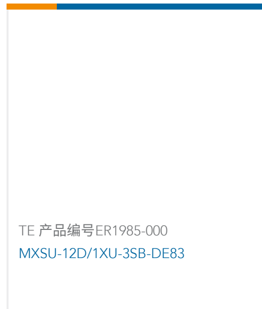
TE 产品编号ER1985-000 MXSU-12D/1XU-3SB-DE83