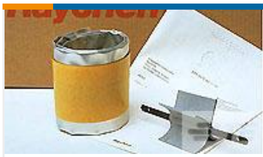
TE 产品编号828695-000 RDSS-100(S10)