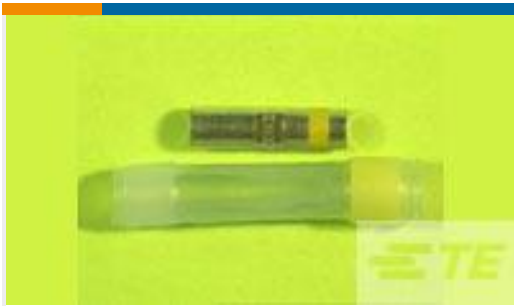
TE 产品编号 650075-000 D-436-37