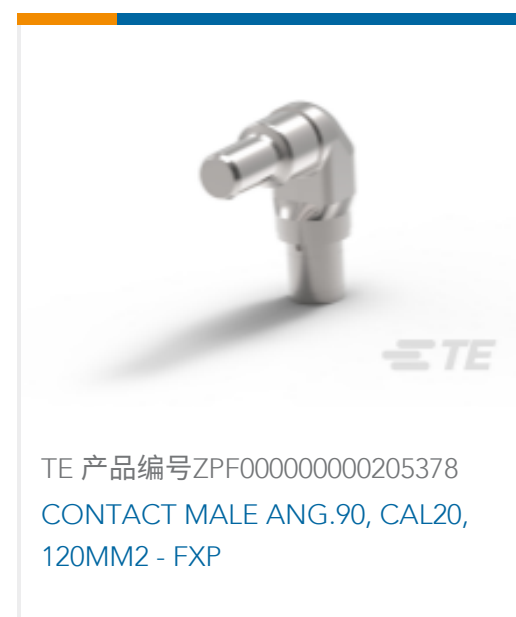
TE 产品编号ZPF000000000205378 CONTACT MALE ANG.90, CAL20, 120MM2 - FXP