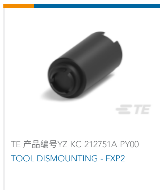
TE 产品编号YZ-KC-212751A-PY00 TOOL DISMOUNTING - FXP2