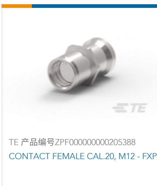
TE 产品编号ZPF000000000205388 CONTACT FEMALE CAL.20, M12 - FXP