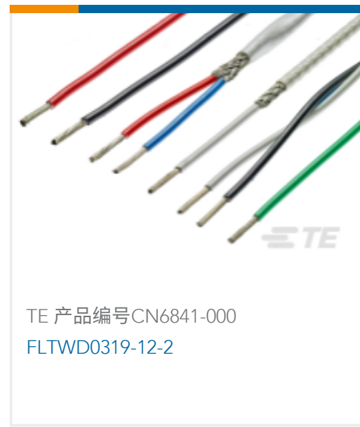
TE 产品编号CN6841-000 FLTWD0319-12-2