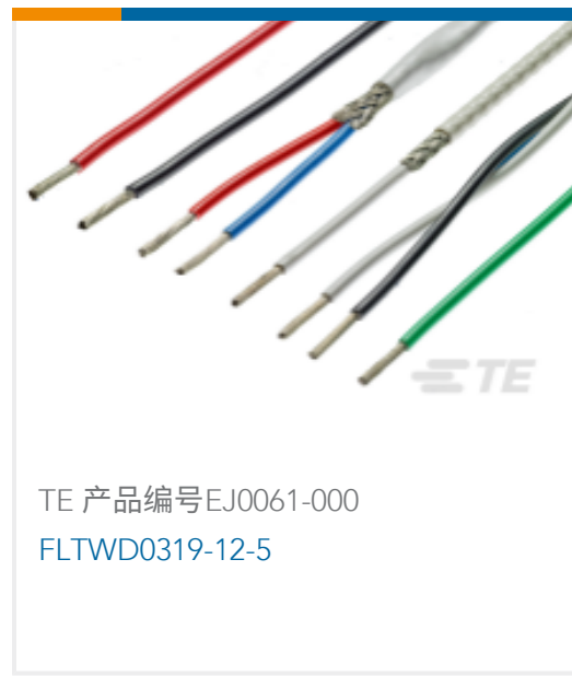
TE 产品编号EJ0061-000 FLTWD0319-12-5