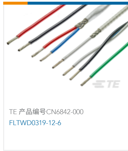
TE 产品编号CN6842-000 FLTWD0319-12-6