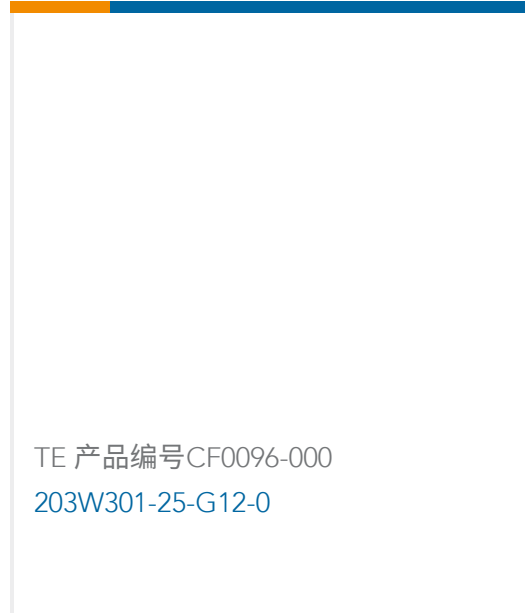
TE 产品编号CF0096-000 203W301-25-G12-0