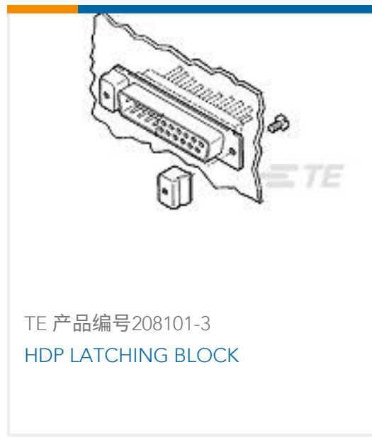
TE 产品编号208101-3 HDP LATCHING BLOCK