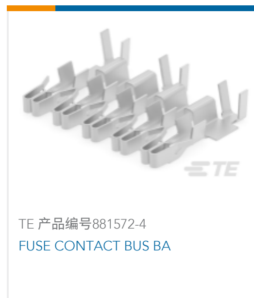
TE 产品编号881572-4 FUSE CONTACT BUS BA