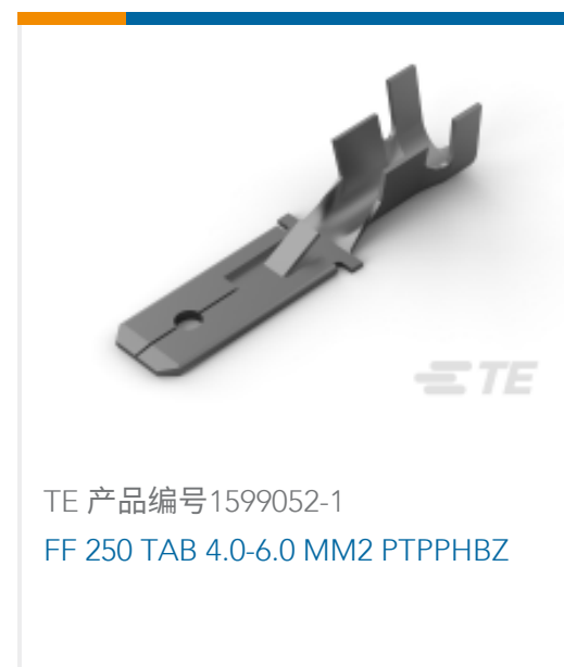
TE 产品编号1599052-1 FF 250 TAB 4.0-6.0 MM2 PTPPHBZ