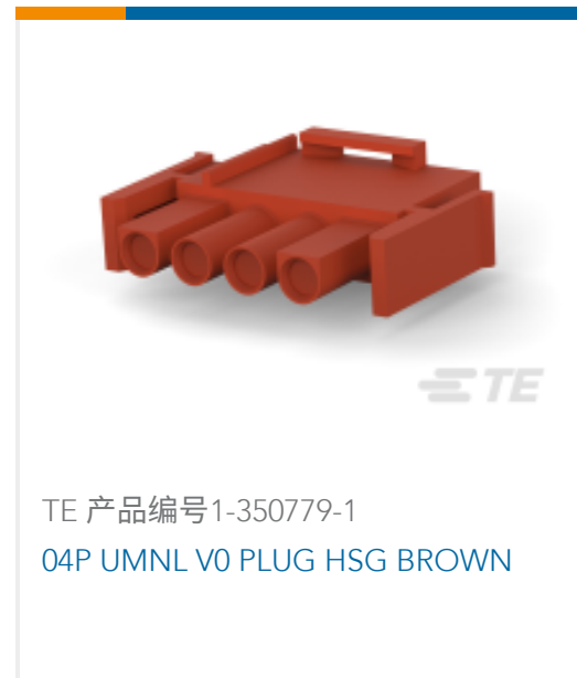
TE 产品编号1-350779-1 04P UMNL V0 PLUG HSG BROWN