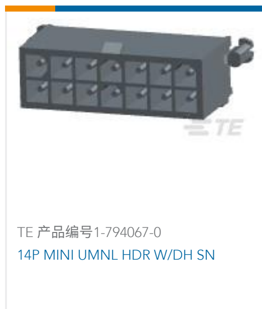
TE 产品编号1-794067-0 14P MINI UMNL HDR W/DH SN