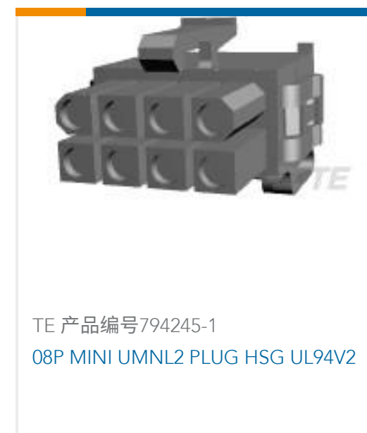
TE 产品编号794245-1 08P MINI UMNL2 PLUG HSG UL94V2