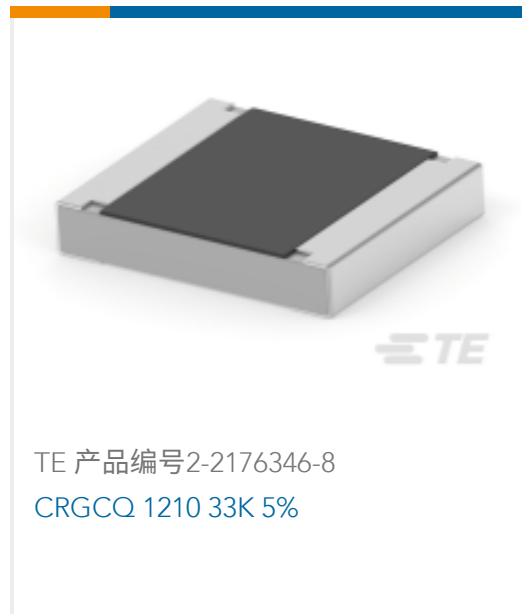
TE 产品编号2-2176346-8 CRGCQ 1210 33K 5%