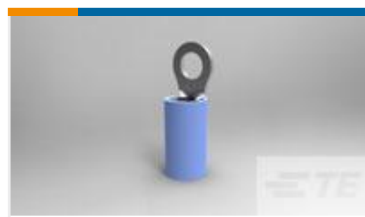
TE 产品编号320619 TERMINAL,PIDG R 16-14 6