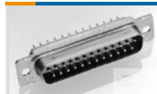
TE 产品编号1757828-1 AMPLIMITE,RCPT ASY,POSTD,109,ZN, 1