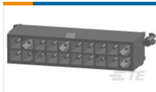
TE 产品编号1-794070-1 20P MINI UMNL HDR W/DH AU LF