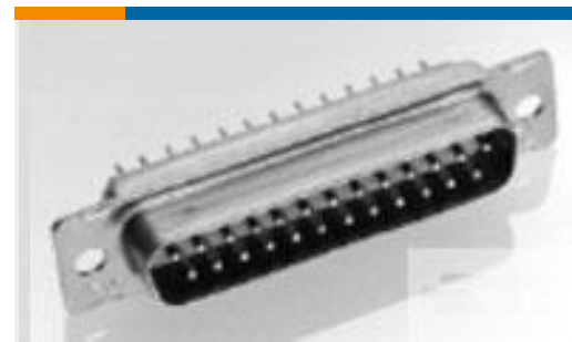
TE 产品编号1218125-5 50 POS,ASSY,PLUG,LOW PROF,109