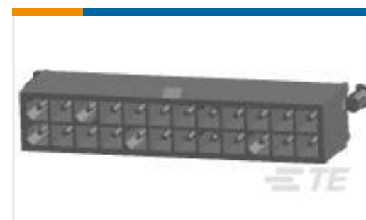
TE 产品编号1-794072-1 24P MINI UMNL HDR W/DH AU LF