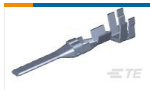
TE 产品编号177916-1 AMP POWER DBL LOCK TAB (S)