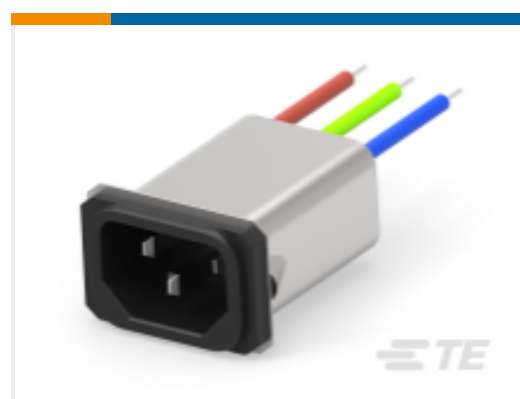
TE 产品编号2-6609985-0 6EJMS8=F8202