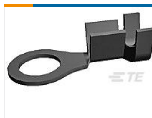
TE 产品编号40517 RING 18-14 8 .030TPBR