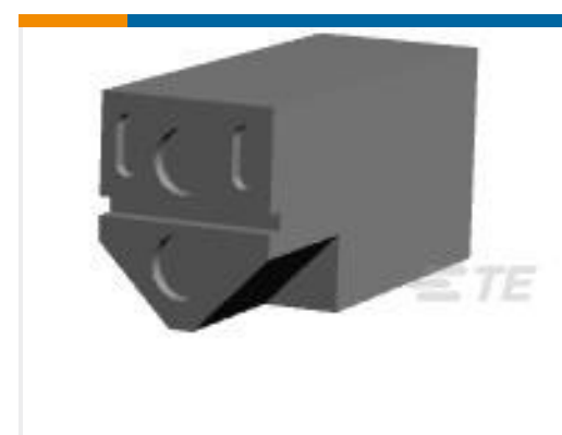
TE 产品编号770364-1 02P .093 COMM P&S RECPT .248CL