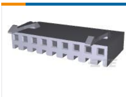
TE 产品编号770894-9 09P SL156 HSG W/THRU BD LATCH