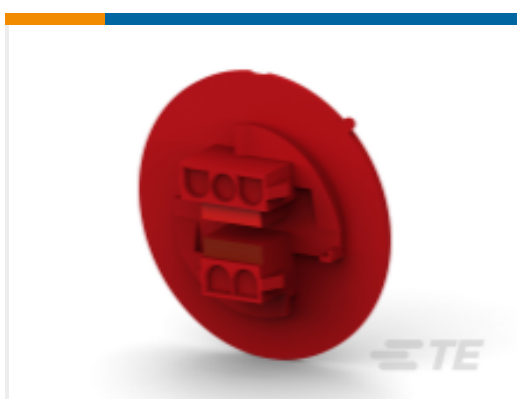
TE 产品编号2294562-2 UMNL TWIST-N-LOK, 5POS, CAP HOUSING