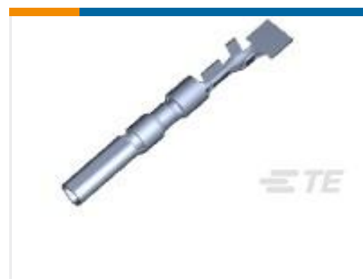
TE 产品编号1-794217-0 MINI UMNL2 SOK 30-26AWG AU LF