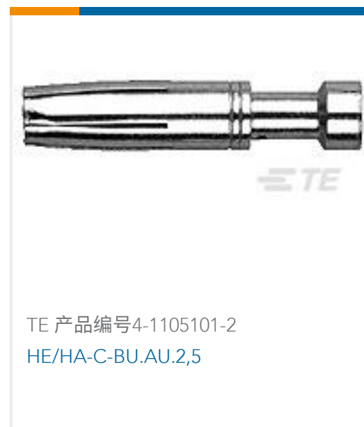
TE 产品编号4-1105101-2 HE/HA-C-BU.AU.2,5