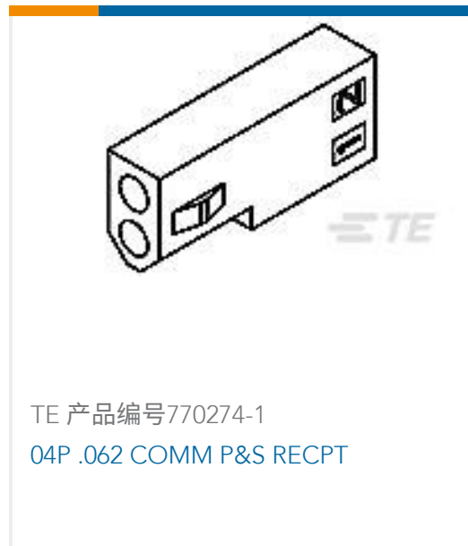
TE 产品编号770274-1 04P .062 COMM P&S RECT