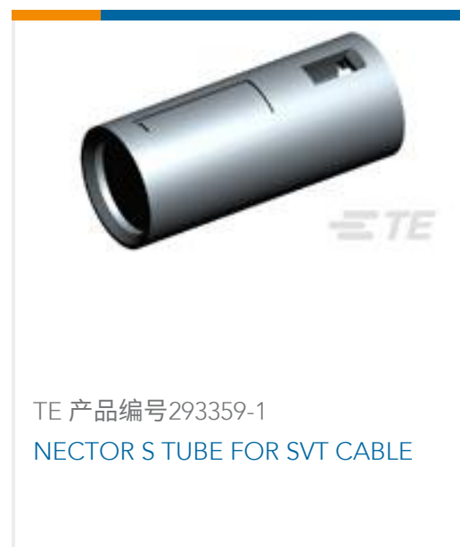
TE 产品编号293359-1 NECTOR S TUBE FOR SVT CABLE