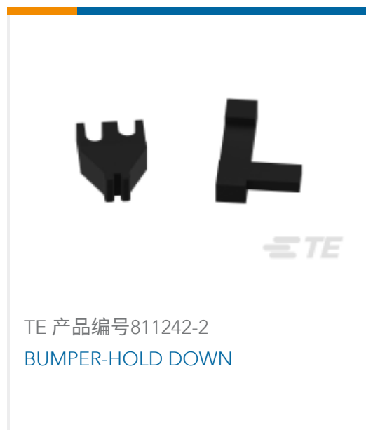
TE 产品编号811242-2 BUMPER-HOLD DOWN