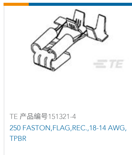
TE 产品编号151321-4 250 FASTON, FLAG, REC., 18-14 AWG, TPBR