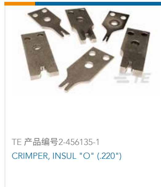
TE 产品编号2-456135-1 CRIMPER, INSUL "O" (.220")