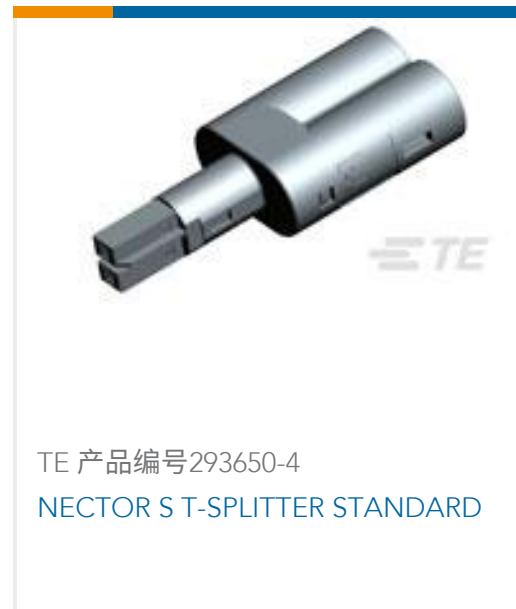
TE 产品编号293650-4 NECTOR S T-SPLITTER STANDARD