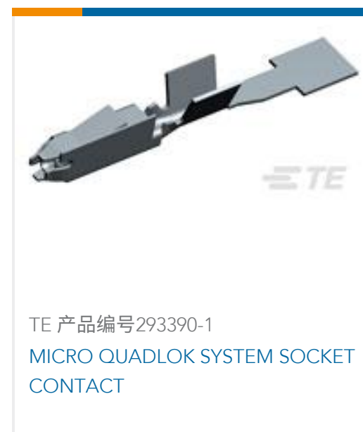
TE 产品编号293390-1 MICRO QUADLOK SYSTEM SOCKET CONTACT