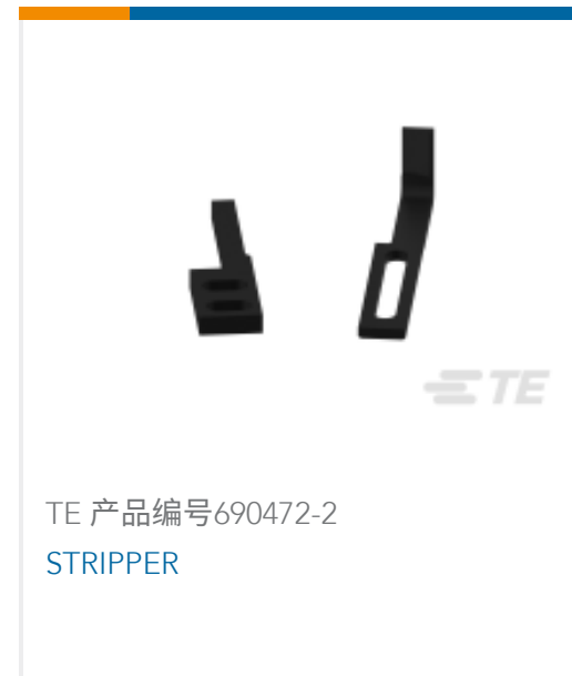
TE 产品编号690472-2 STRIPPER