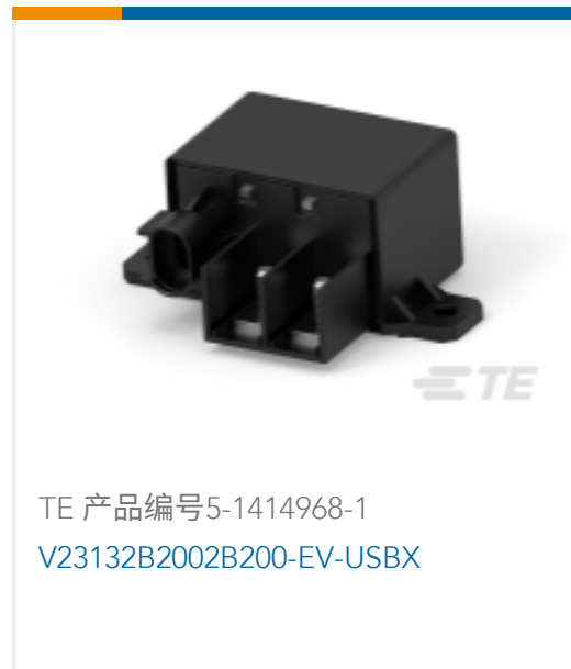
TE 产品编号5-1414968-1 V23132B2002B200-EV-USBX