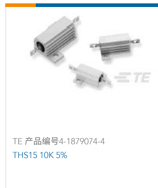
TE 产品编号4-1879074-4 THS15 10K 5%