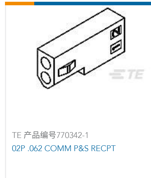
TE 产品编号770342-1 02P .062 COMM P&S RECPT