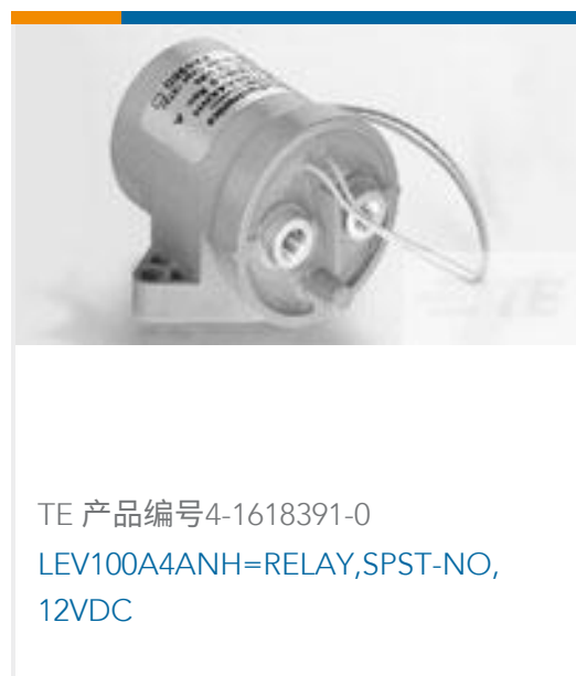
TE 产品编号4-1618391-0 LEV100A4ANH=RELAY,SPST-NO, 12VDC