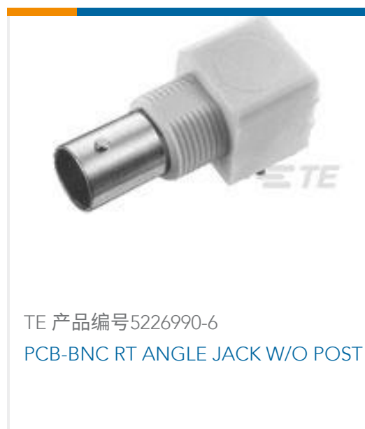
TE 产品编号5226990-6 PCB-BNC RT ANGLE JACK W/O POST