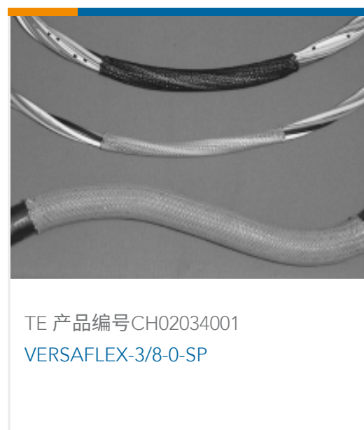
TE 产品编号CH02034001 VERSAFLEX-3/8-0-SP