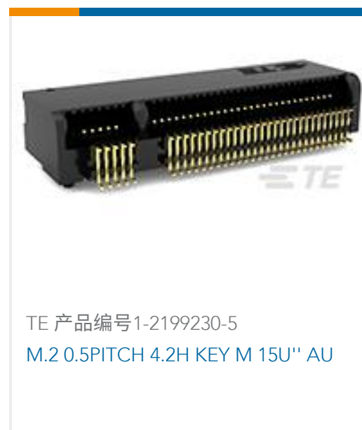
TE 产品编号1-2199230-5 M.2 0.5PITCH 4.2H KEY M 15U" AU