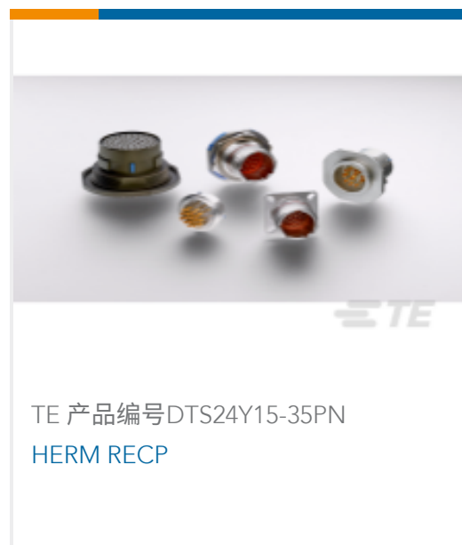
TE 产品编号DTS24Y15-35PN HERM RECP