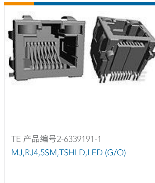
TE 产品编号2-6339191-1 MJ,RJ4,5SM,TSHLD,LED (G/O)