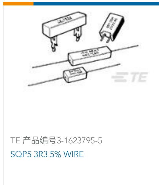
TE 产品编号3-1623795-5 SQP5 3R3 5% WIRE