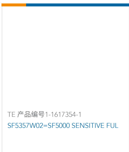
TE 产品编号1-1617354-1 SF5357W02=SF5000 SENSITIVE FUL