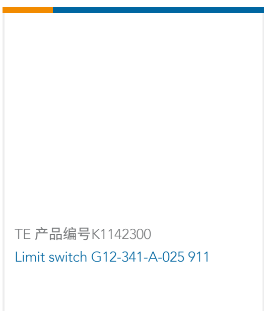
TE 产品编号K1142300 Limit switch G12-341-A-025 911