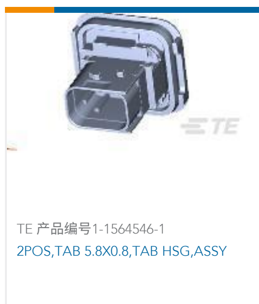
TE 产品编号1-1564546-1 2POS,TAB 5.8X0.8,TAB HSG,ASSY