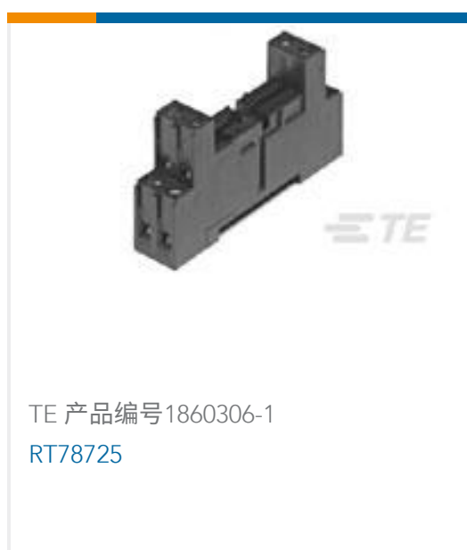
TE 产品编号1860306-1 RT78725