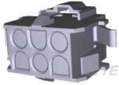
TE 产品编号770051-1 06P UMNL II CAP-FRONT 94VO