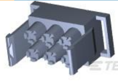
TE 产品编号770038-1 06P UMNL II PLUG REAR 94VO