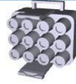
TE 产品编号770042-1 12P UMNL II PLUG REAR 94VO