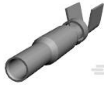
TE 产品编号770004-4 UMNL II SOK SN/AUNI/PHBZ