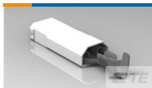
TE 产品编号521011-2 ULTRA-POD 250 ASSY REC 18-14 AWG TPBR