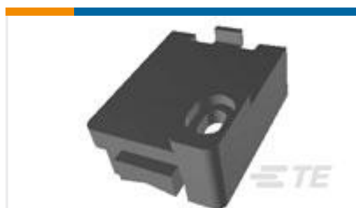
TE 产品编号640716-1 09P UMNL STR/REL & INSRT