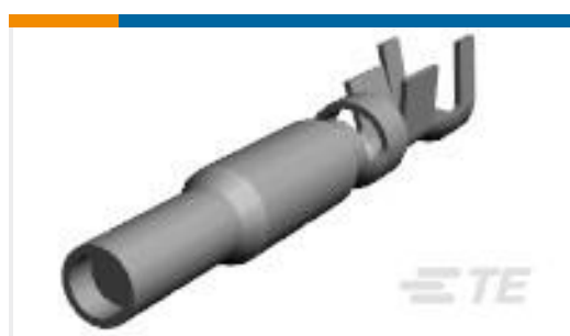
TE 产品编号770008-3 UMNL II SOK PTPPHBZ