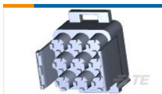
TE 产品编号770054-1 09P UMNL II CAP REAR 94VO