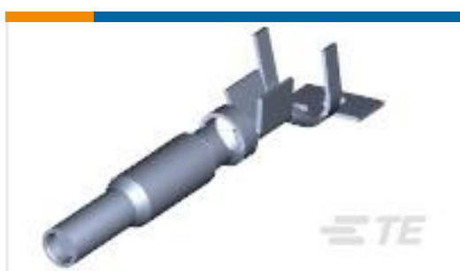
TE 产品编号770006-3 UMNL II SOK PTPPHBZ