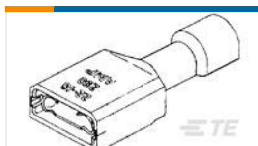
TE 产品编号3-350815-2 ULTRA-FAST 187 ASY REC 16-14 AWG TPBR