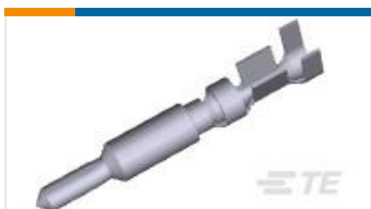
TE 产品编号770250-1 UMNL II PIN PTPBR LP 20-14