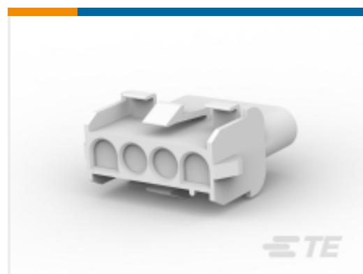
TE 产品编号 1586845-1 04P UMNL CAP HSG NATL, GW