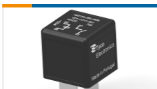
TE 产品编号4-1393306-6 VF711F11S01/X836