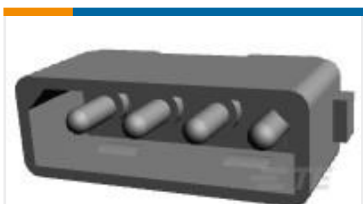
TE 产品编号794236-1 04P CMNL HDR ASSY V0