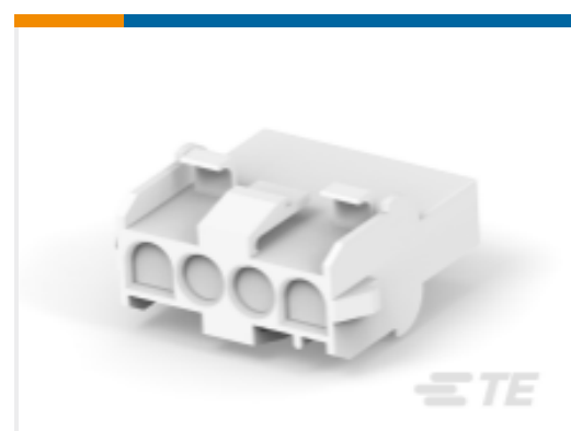
TE 产品编号 926305-1 4P UNIV M-N-L CAP