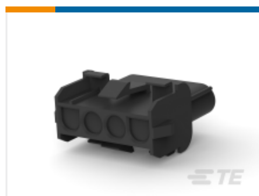
TE 产品编号 794707-1 04P UMNL CAP HSG, BLACK