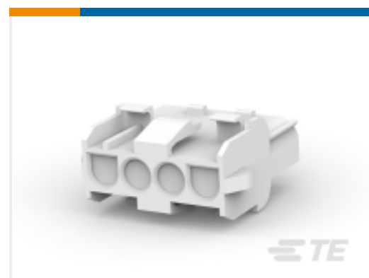
TE 产品编号 926305-6 UNML4WAY CAP