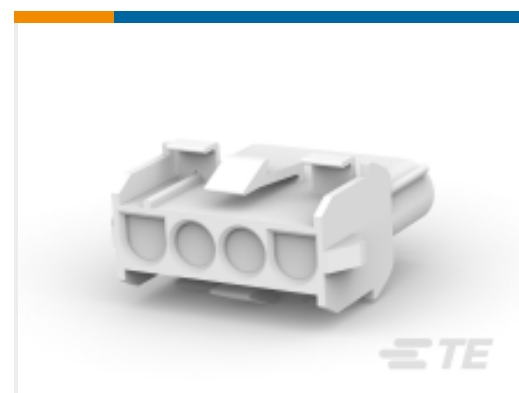
TE 产品编号 2-480703-0 04P UMNL CAP HSG NATL