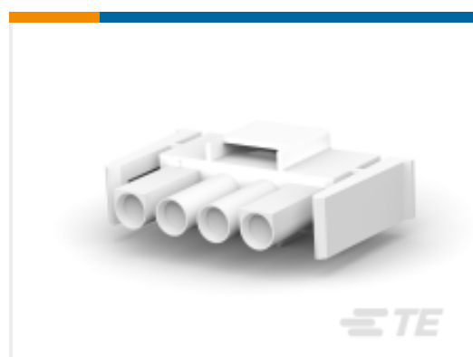
TE 产品编号 770035-1 04P UMNL II PLUG-FRONT 94VO