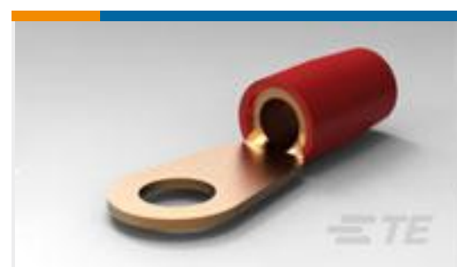
TE 产品编号324082 TERMINAL, T-N R 8 1/4