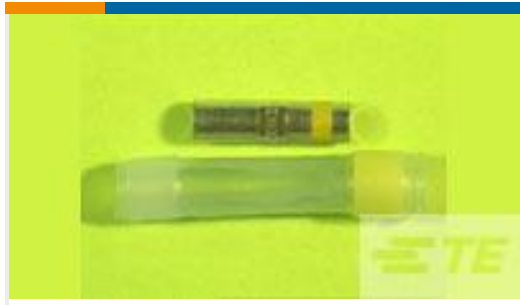
TE 产品编号650075-000 D-436-37