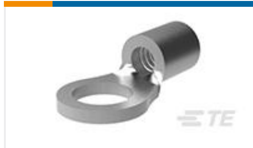
TE 产品编号2-34124-1 TERMINAL,SOLIS R 16-14 1/4