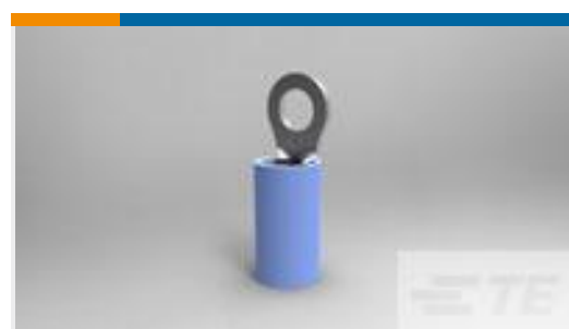
TE 产品编号51864 TERMINAL, PIDG R 16-14 6