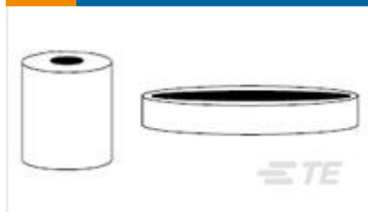
TE 产品编号D73542-001 URHR-2