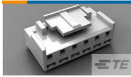
TE 产品编号1-1123722-7 3.96 EP PLUG HSG 7P(NATURAL)