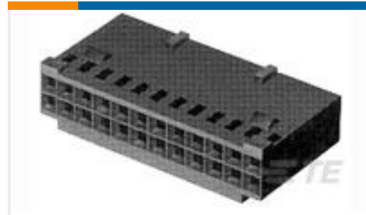
TE 产品编号1-87631-9 24 MODIV HSG COMP DR .100 POL