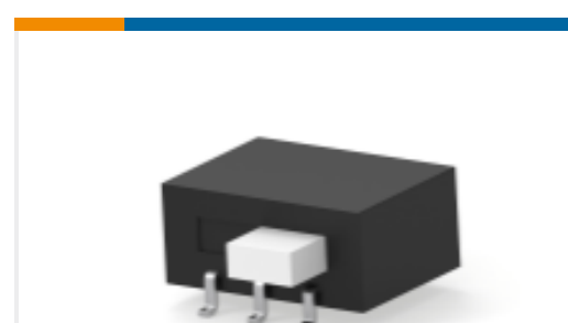
TE 产品编号1-1437581-1 ASE22RL=AUTOSLIDE DP