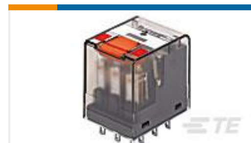
TE 产品编号3-1415020-1 PT570N20