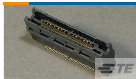
TE 产品编号 767094-2 MICT, RECPT, 076, ASY, PDNI, EXTD