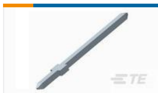
TE 产品编号 1-928836-2 MOD2 PIN WITH A-PIN L/P