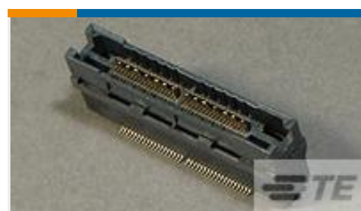
TE 产品编号 767154-2 76 POS. .355 VERTICAL RECEPTAC