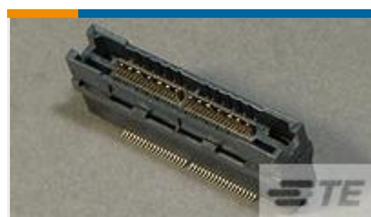
TE 产品编号 767153-9 72 POS. .355 VERTICLE RECEPTAC