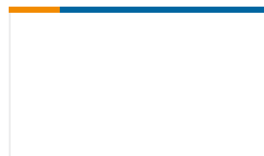
TE 产品编号 767179-2 MICTOR R/A RECEPT ASSY 76 POS.