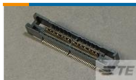
TE 产品编号 767114-9 MICT, REC, 076, ASY, .025, TAPE PKG