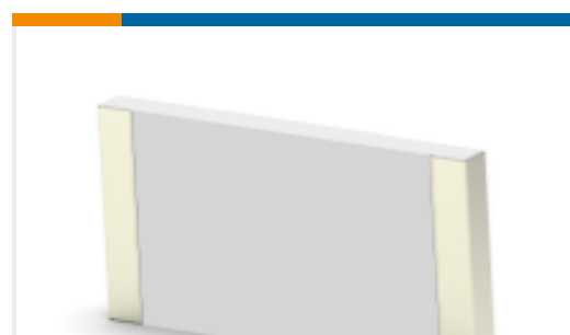
TE 产品编号 7-2176246-6 CRGS2512 5% 1M8