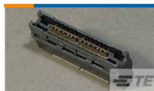
TE 产品编号 767178-2 MICTOR .355 RECEPTACLE, 76 POS T&R PACKA