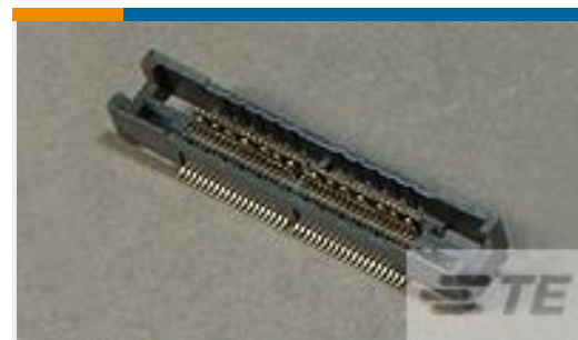
TE 产品编号 767096-2 MICT, REC, 076, ASY, .025, TAPE PKG