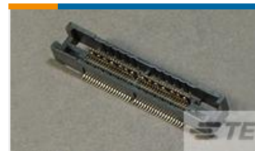
TE 产品编号 767110-2 MICT, RECPT, 076, ASSY, .025