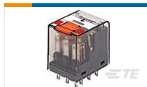
TE 产品编号 3-1415020-1 PT570N20