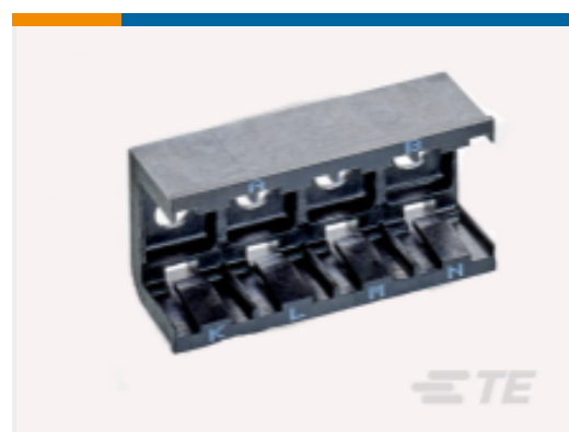
TE 产品编号DCR-1A-06 COMPOSIT RAIL