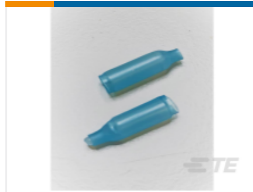
TE 产品编号039695-000 CTA-0013