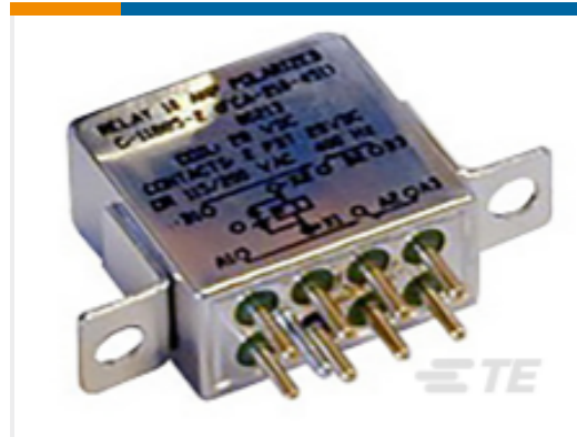
TE 产品编号1-1617749-5 FCA-210-1020M=M83536/10-020M