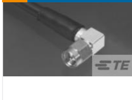
TE 产品编号1052203-1 2037 8126 92