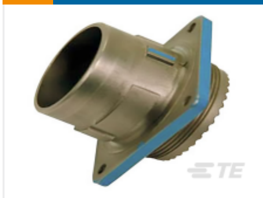
TE 产品编号YDIV46E25-61SNC128 PLUG ASSY