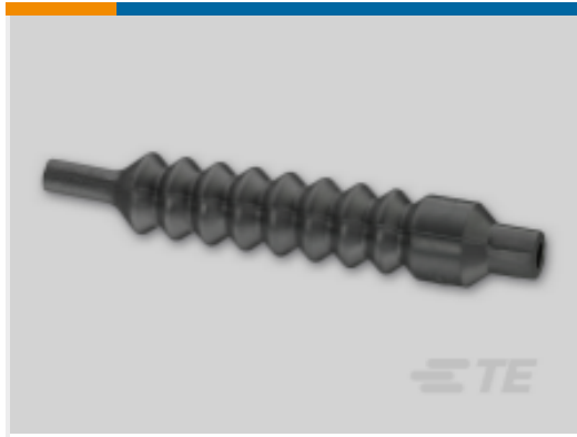
TE 产品编号F67100-000 202C653-770-0