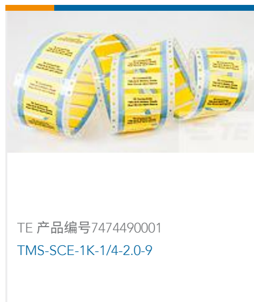
TE 产品编号7474490001 TMS-SCE-1K-1/4-2.0-9