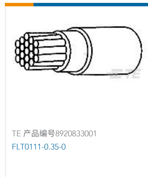
TE 产品编号8920833001 FLT0111-0.35-0