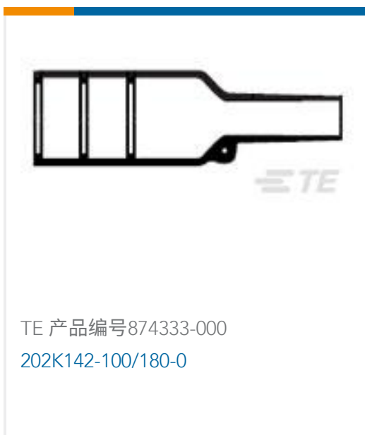
TE 产品编号874333-000 202K142-100/180-0