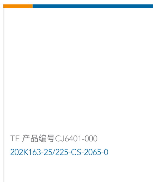
TE 产品编号CJ6401-000 202K163-25/225-CS-2065-0