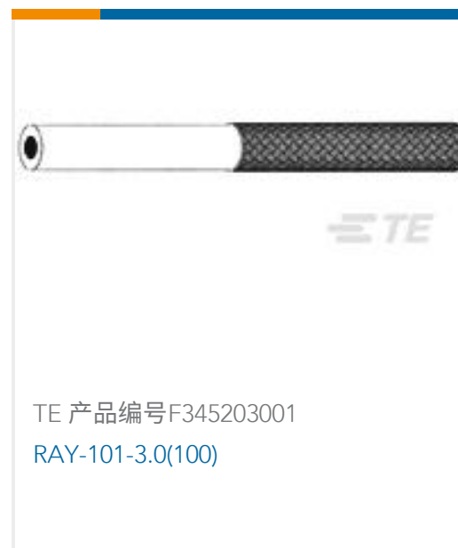
TE 产品编号F345203001 RAY-101-3.0(100)