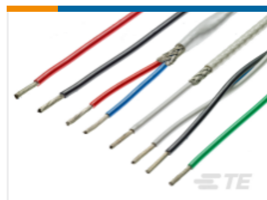
TE 产品编号2611473001 44A0111-12-54