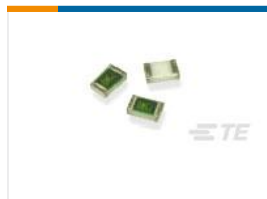
TE 产品编号6-1879127-7 RN 0402 422R 0.1% 10PPM CUT LENGTH