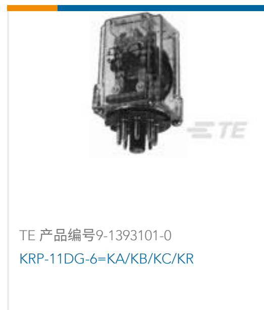
TE 产品编号9-1393101-0 KRP-11DG-6=KA/KB/KC/KR