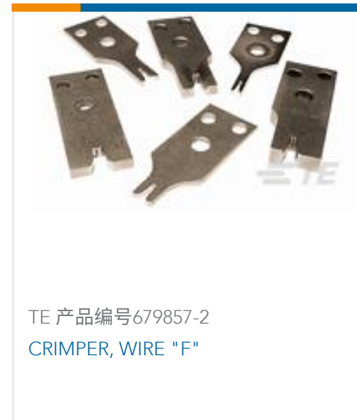
TE 产品编号679857-2 CRIMPER, WIRE "F"