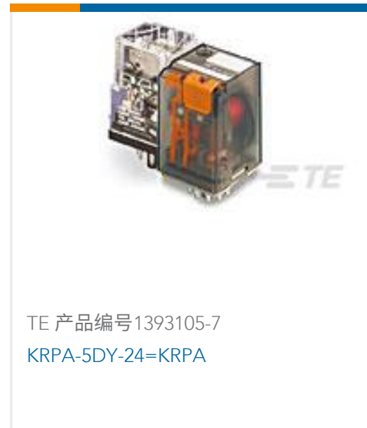
TE 产品编号1393105-7 KRPA-5DY-24=KRPA