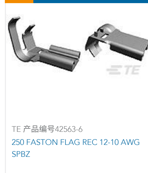
TE 产品编号42563-6 250 FASTON FLAG REC 12-10 AWG SPBZ