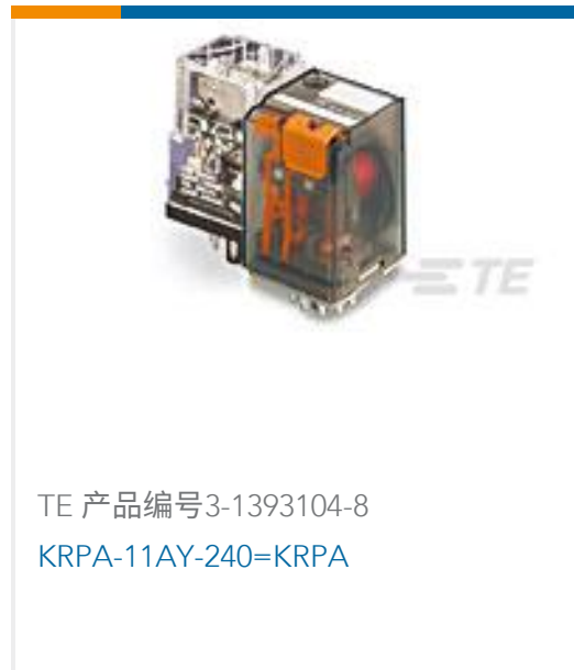
TE 产品编号3-1393104-8 KRPA-11AY-240=KRPA