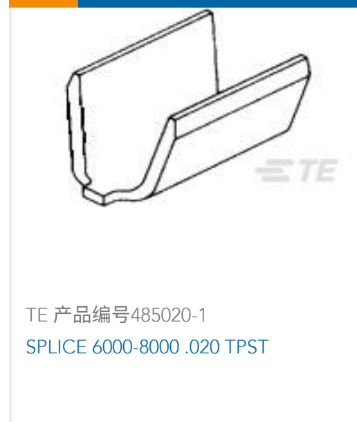
TE 产品编号485020-1 SPLICE 6000-8000 .020 TPST