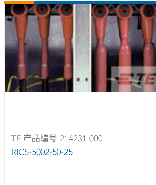
TE 产品编号 214231-000 RICS-5002-50-25