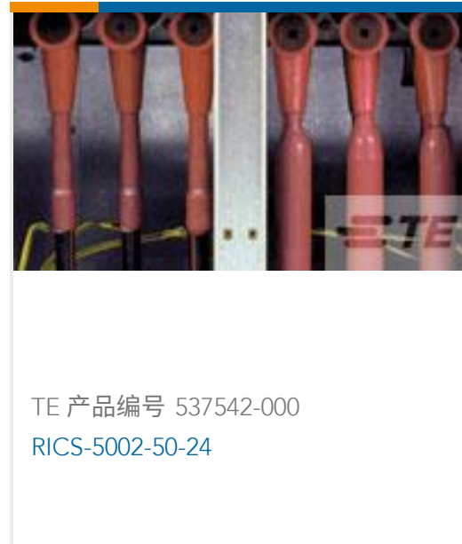
TE 产品编号 537542-000 RICS-5002-50-24