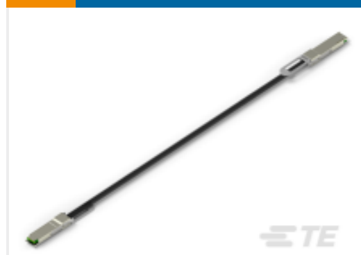
TE 产品编号2333393-7 QSFP 25GIG 30AWG 3 METER