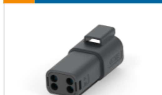
TE 产品编号1-2600030-0 4CCT BLACK RECEP W/LARGE SEAL