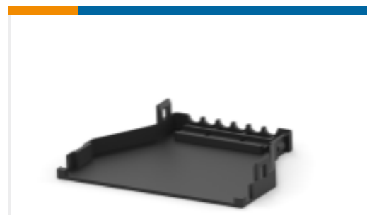
TE 产品编号1776695-1 Strain Relief, D5200, Dynamic AU,TB