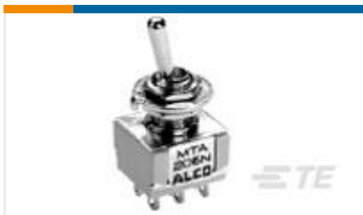
TE 产品编号6-1437558-8 MTE106D=(MSTE) SW TOG WATERPRO