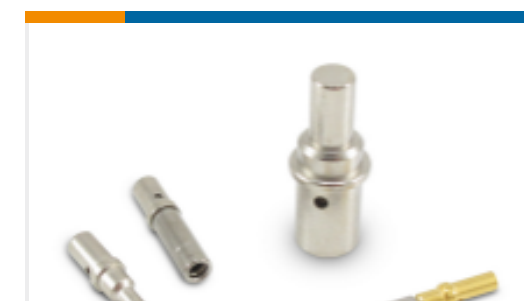
TE 产品编号0460-202-16141 DEUTSCH Solid Contacts