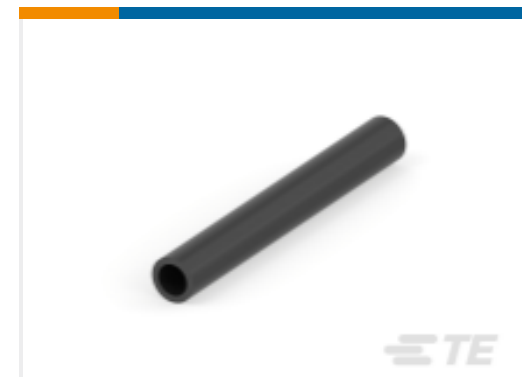
TE 产品编号8208596007 RBK-ILS 热缩管