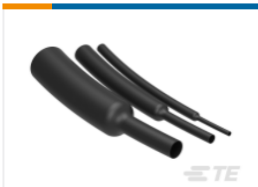
TE 产品编号5068104006 CGPT 2:1 热缩管