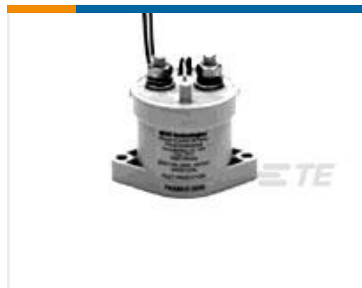
TE 产品编号1-1618002-8 EV200HAANA=RELAY, SPST-NO WITH