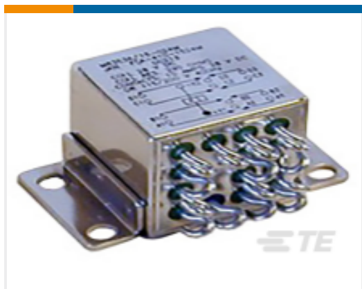
TE 产品编号1617756-4 FCA-410-CY3