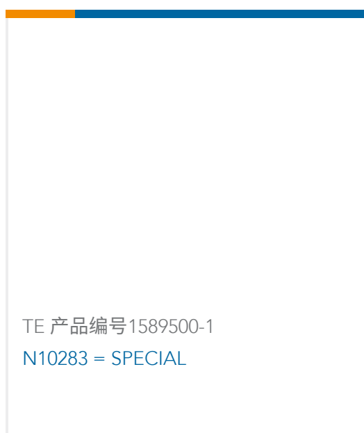
TE 产品编号1589500-1 N10283 = SPECIAL