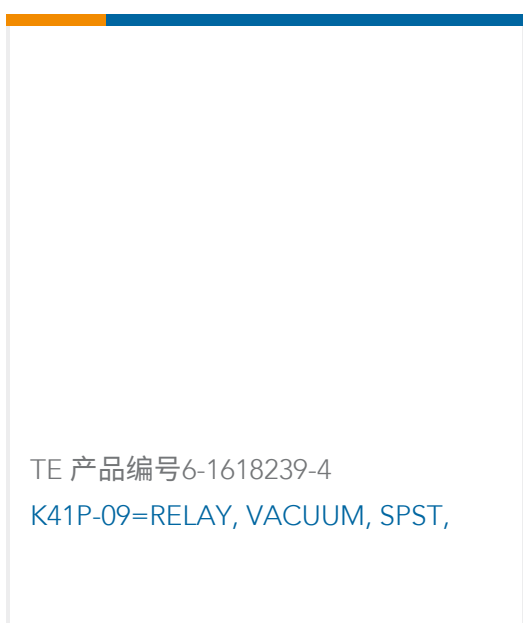
TE 产品编号6-1618239-4 K41P-09=RELAY, VACUUM, SPST,