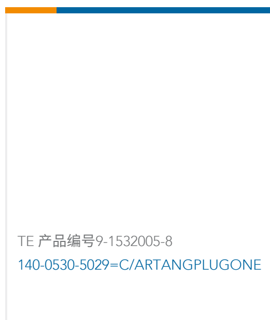
TE 产品编号9-1532005-8 140-0530-5029=C/ARTANGPLUGONE