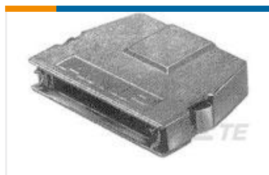
TE 产品编号749196-2 80 50SR KIT,ST,UK