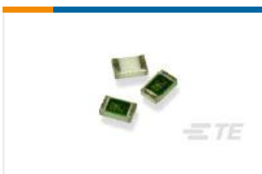
TE 产品编号1-1879417-1 CPF 0603 470K 0.1% 25PPM 1K RL