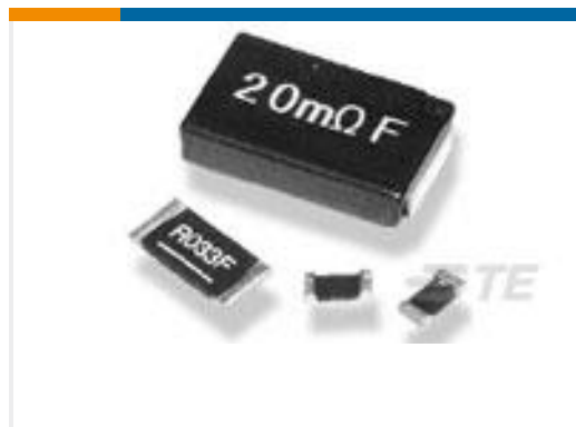
TE 产品编号2-1879378-3 TLR 2512 3.0W R0015 1% 50PPM 2K RL