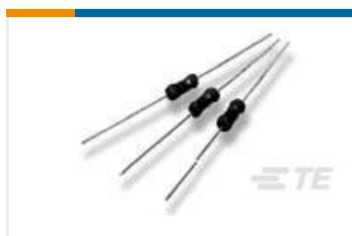
TE 产品编号3-1625890-5 2W SM M/OX 5% 270R