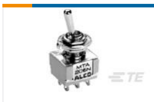
TE 产品编号1-1437559-8 MTG206N=SWITCH TOG MUSTANG