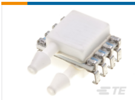
TE 产品编号4525DO-DS5A1001DP 1IN PCB MOUNT I2C DIFF PRESSURE SENSOR