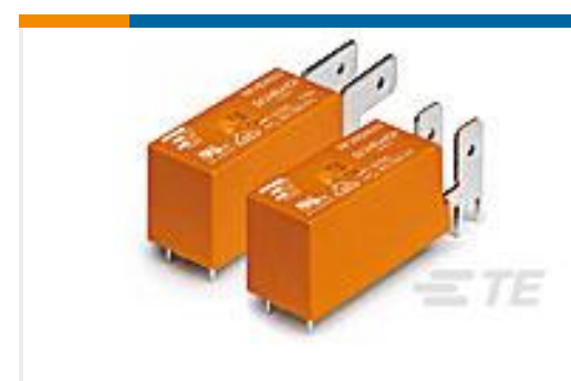
TE 产品编号6-1415520-1 RFH34024WG