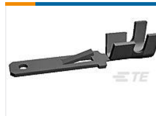
TE 产品编号160457-2 FF 250 TAB 18-14AWG TPPB