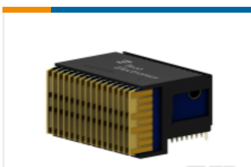
TE 产品编号2221861-1 DC, 7Row, Center, MULTIGIG RT 2R