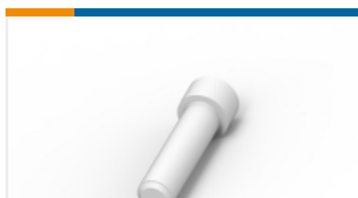
TE 产品编号114017-ZZ SEALING PLUG, SIZE 12/16, WHT