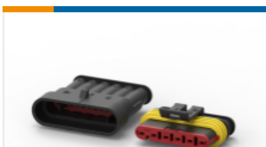
TE 产品编号282104-1 AMP SUPERSEAL 1.5MM, 连接器壳体