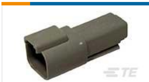
TE 产品编号DT04-2P REC, 2P, GRY, N