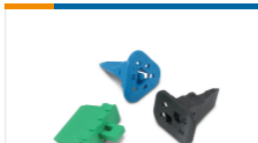
TE 产品编号W2S Wedgelocks: DEUTSCH DT