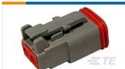
TE 产品编号DT06-2S PLG, 2P, GRY, N