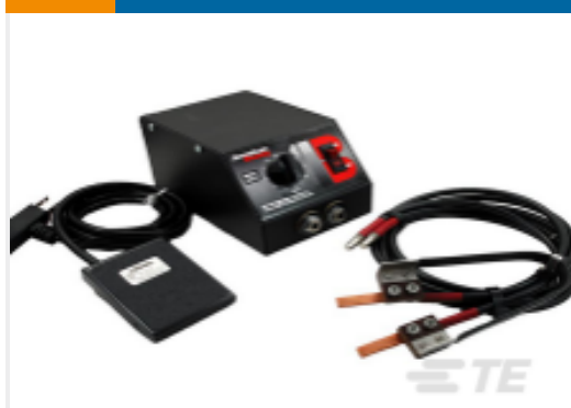
TE 产品编号 173643-000 RH-3960-1-TINEL-KIT-120V