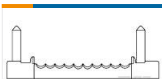
TE 产品编号 749108-4 50 50SR CBL CONN TERM COVER