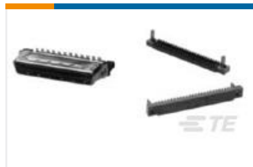
TE 产品编号1-5750913-9 100 50SR CABLE CONN KIT