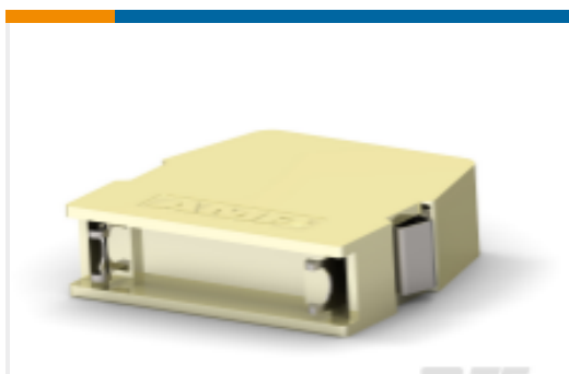
TE 产品编号5749191-1 28 50SR KIT,ST,UK