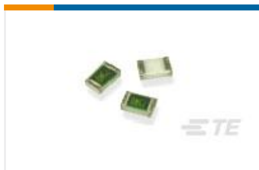
TE 产品编号7-2176088-2 RP 1J 0.166W 4K99 0.1% 25PPM 1K RL