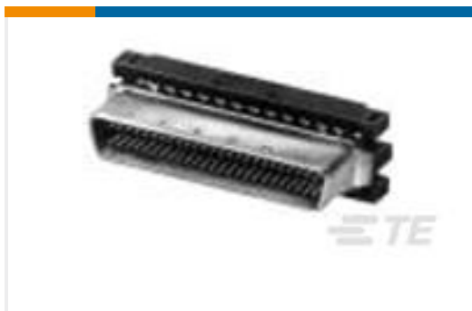
TE 产品编号5749111-8 100 50SR CABLE PLUG ASSY