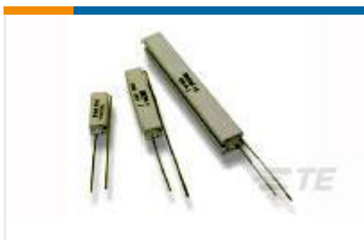
TE 产品编号2-1623730-7 BCHE 4 W 6R8 10%