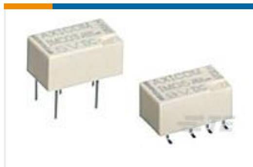
TE 产品编号1462042-9 IMC06CGR=IM Relay 140mW 12V 1CO