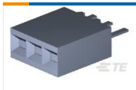
TE 产品编号5-534237-1 03 MODII VRT SR CE 100/115