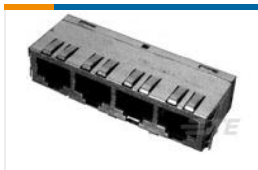
TE 产品编号5406203-3 MJ ASSY,4P,8POS,SH,CAT5,NS P/O