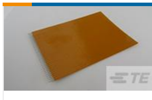
TE 产品编号2-1437186-9 FST-21A-15