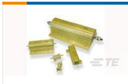
TE 产品编号5-1625971-4 HSA25 4R7 5%