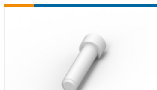
TE 产品编号114017-ZZ SEALING PLUG, SIZE 12/16, WHT