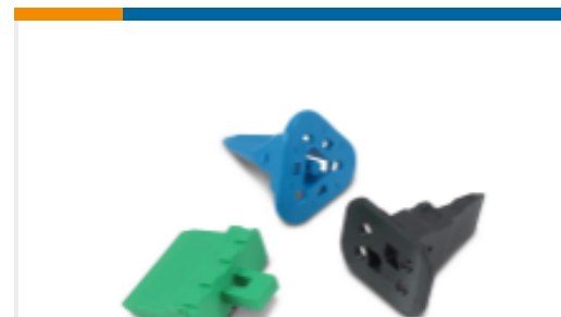
TE 产品编号W2S Wedgelocks: DEUTSCH DT