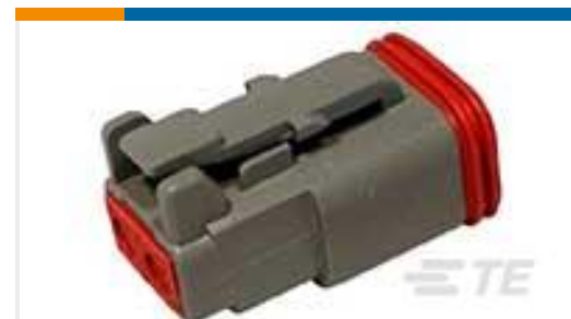
TE 产品编号DT06-2S PLG, 2P, GRY, N