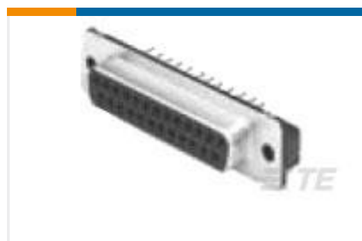
TE 产品编号2-747708-0 25 RCPT SP/FMS BRDLK