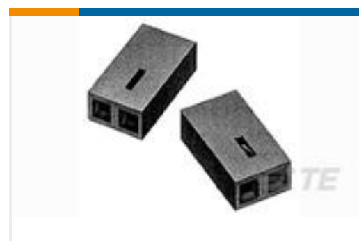
TE 产品编号390088-1 BLACK HSG WITH 30AU CONTACT