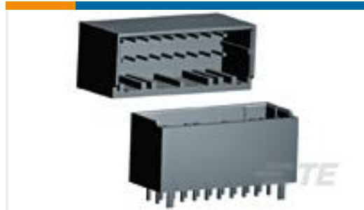
TE 产品编号1-2040516-5 DYNAMIC 1100D HDR ASSY V 10PX BLACK GOLD