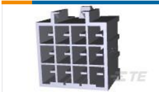
TE 产品编号179843-1 AMP POWER D/LOCK T/HDR ASY 12P