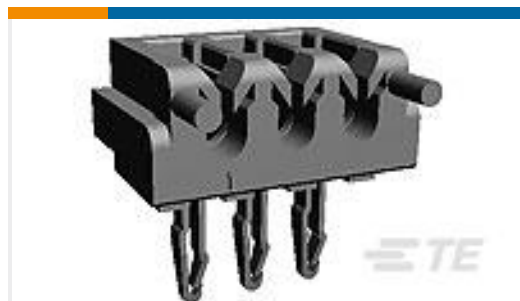
TE 产品编号3-173983-5 AMP CT MT AMP-IN HDR-H YEL 15P