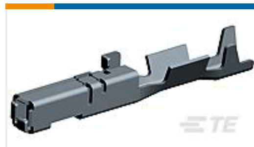
TE 产品编号1674936-1 0.64 III RCPT NON SEALED TIN (S)