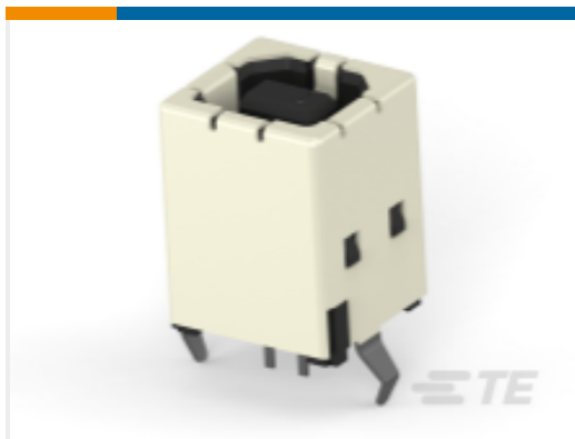
TE 产品编号5787834-2 STD USB TYPE B, VERTICAL, T/H, NATURAL