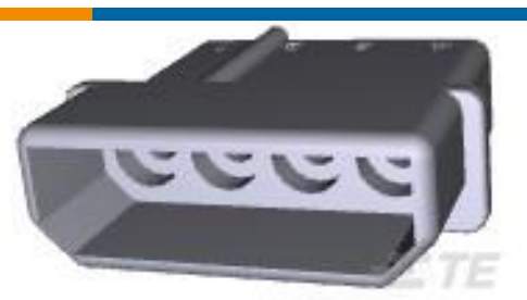
TE 产品编号1-480426-0 04P CMNL CAP HSG F/H NATL