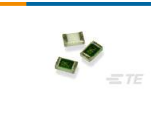
TE 产品编号4-1614881-7 CPF 0603 30R 0.1% 25PPM 5K RL