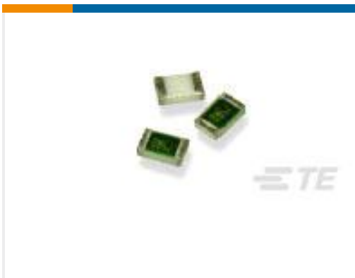
TE 产品编号4-1879338-6 CPF 0603 78K7 1% 50PPM 1K RL