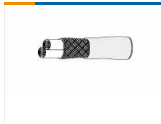
TE 产品编号439444-001 55A1132-22-0/2/9-9