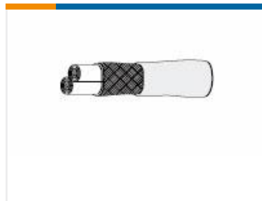
TE 产品编号152999-000 55A1111-24-9-9CS2275