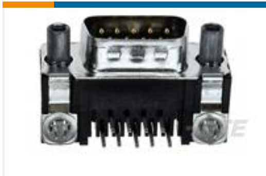
TE 产品编号5747843-6 37 MSFL PLUG RA 318 (SL,FM,BL)