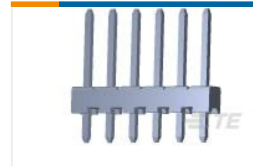
TE 产品编号3-644456-6 06P MTA100 HDR ASSY (NARROW)