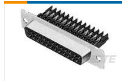
TE 产品编号1-745491-8 09 HDE MS RCPT, 22-26, LEAD FREE