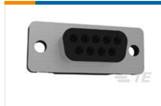
TE 产品编号1658612-4 09 POS HDF RCPT, MS, LEAD FREE