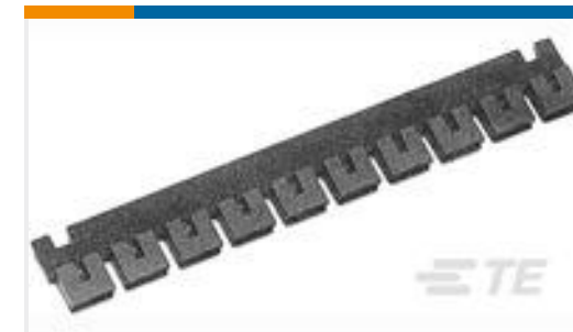
TE 产品编号382575-2 2MM MINI-SHUNT ASSEMBLY 15 AU