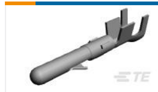
TE 产品编号60618-5 CMNL PIN AUBR L/P