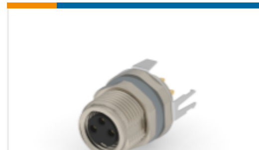
TE 产品编号T4041037031-000 M8.FMLE.PNLREAR.3POS.STR PCBSHLD