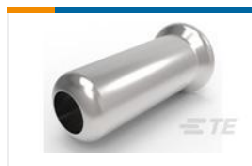
TE 产品编号50935-6 SOCKET, MIN-SPR AU-AU SER-1