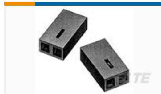
TE 产品编号530153-2 TDM SPRING SHUNT ASSY 2 POS