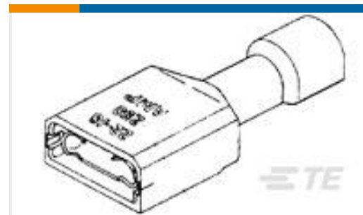
TE 产品编号3-520370-2 ULTRA-FAST 110/125 ASY REC 16- 14AWG TPBR