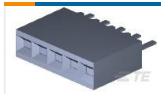
TE 产品编号5-534237-3 05 MODII VRT SR CE 100/115