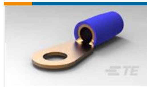
TE 产品编号324048 TERMINAL,T-N R 6 5/16