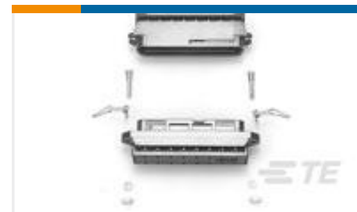
TE 产品编号5552561-3 HDWARE ASSY KIT