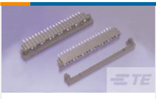
TE 产品编号5-120628-8 LOCKING TRIOMATE ASY 8P(L)LDFFR