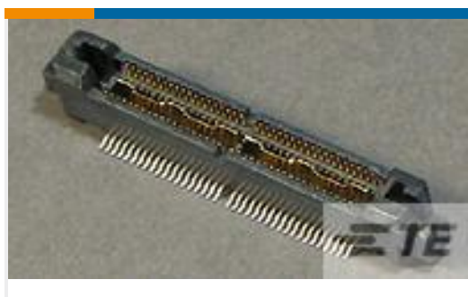
TE 产品编号5767111-9 MICT,PLG,076,ASY,.025 TAPE CAP