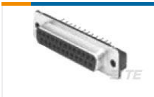
TE 产品编号747299-7 15 RCPT SP/FMS INSRT