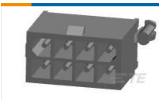
TE 产品编号794073-2 08P MINI UMNL HDR W/O DH AU