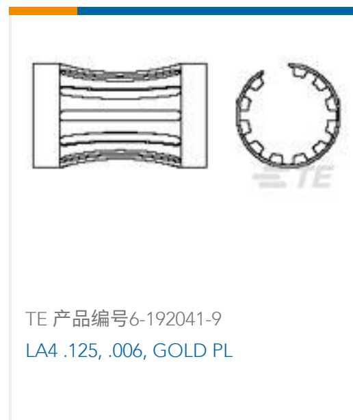
TE 产品编号6-192041-9 LA4 .125, .006, GOLD PL