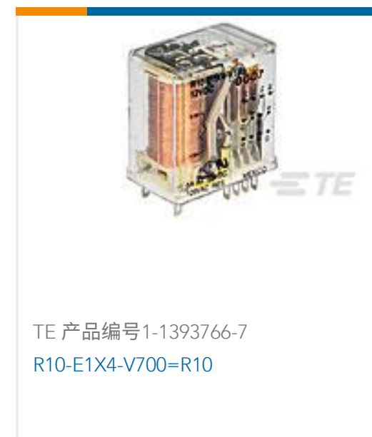
TE 产品编号1-1393766-7 R10-E1X4-V700=R10