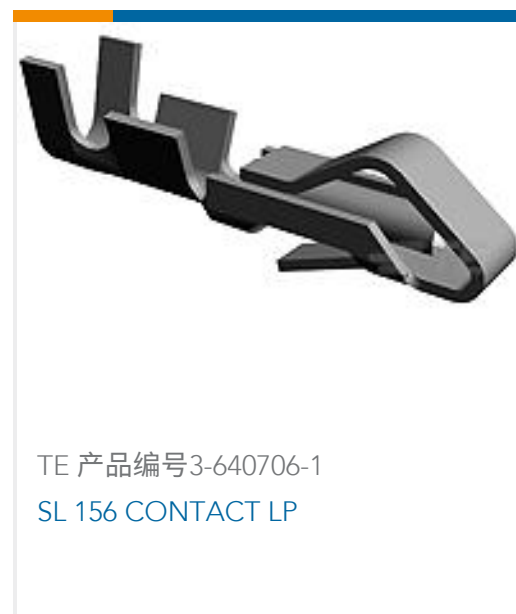
TE 产品编号3-640706-1 SL 156 CONTACT LP