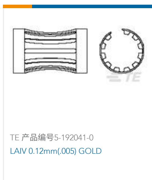
TE 产品编号5-192041-0 LAIV 0.12mm(.005) GOLD