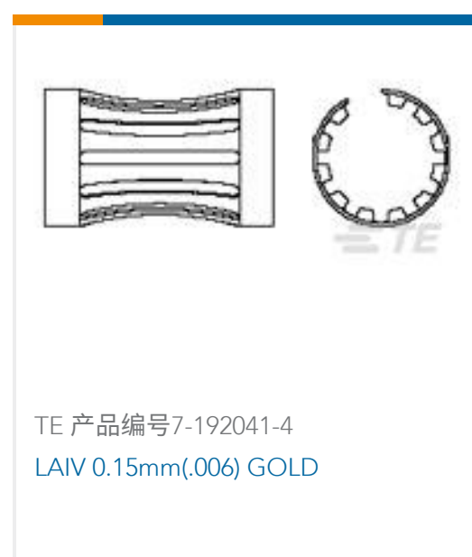
TE 产品编号7-192041-4 LAIV 0.15mm(.006) GOLD