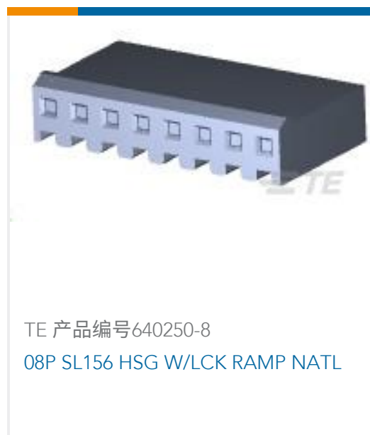
TE 产品编号640250-8 08P SL156 HSG W/LCK RAMP NATL