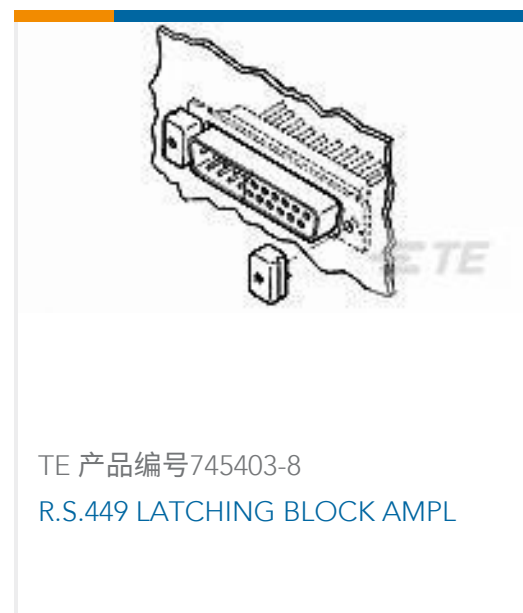
TE 产品编号745403-8 R.S.449 LATCHING BLOCK AMPL