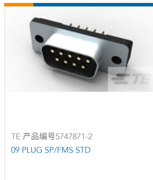
TE 产品编号5747871-2 09 PLUG SP/FMS STD