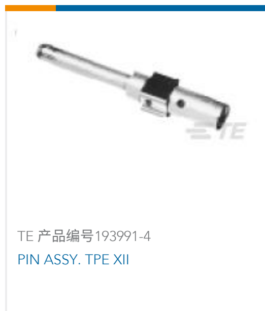
TE 产品编号193991-4 PIN ASSY. TPE XII