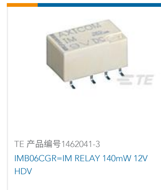
TE 产品编号1462041-3 IMB06CGR=IM RELAY 140mW 12V HDV