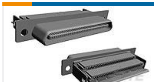
TE 产品编号5787775-1 68 .8MM CHAMP OFFSET CBL KIT