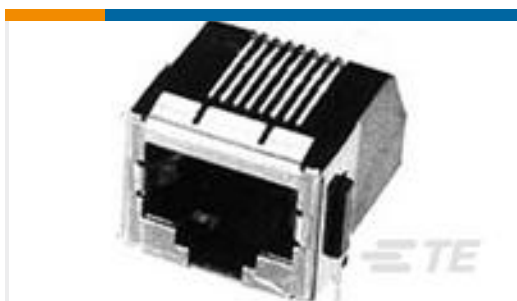
TE 产品编号5555153-1 MJ,LPF,R/A,8P,PCBG,PSTP.15TTR