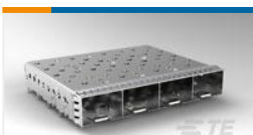
TE 产品编号2149730-2 SFP+ Enhanced 1x4 Cage, PCI Heatsink