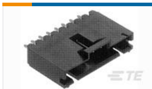
TE 产品编号103638-1 02 MTE HDR SRST LATCH .100CL