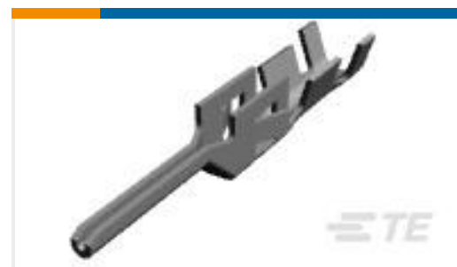
TE 产品编号1-794612-2 PIN CONT 20-24 30 GOLD L/P