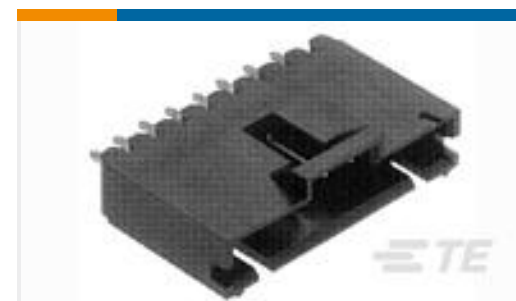
TE 产品编号103670-4 05 MTE HDR SRST LATCH W/HLDWN