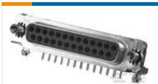
TE 产品编号5747844-3 09 MSFL RCPT RA 318 (IN,FM,BL)