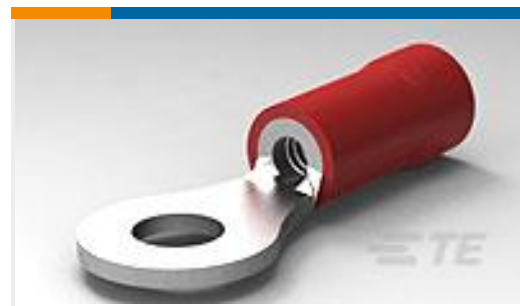
TE 产品编号34147 PG R 22-16 COMM 22-18 MIL 6