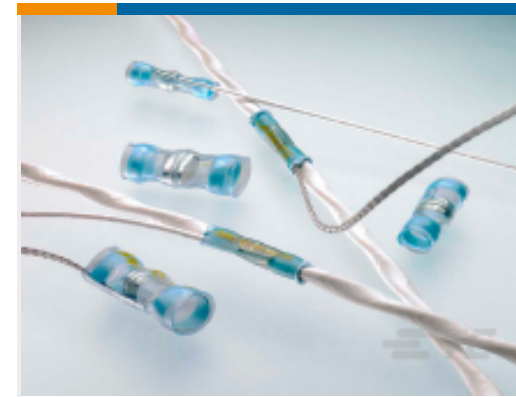
TE 产品编号546353-000 D-704-0042