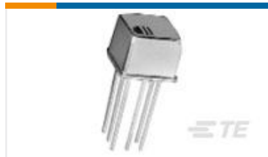
TE 产品编号4-1617352-4 JMGAP-5L=M39016/17-025L