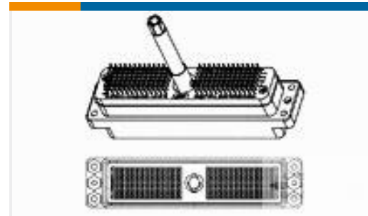
TE 产品编号5353173-2 M-ZIF156P SHORT/SOLDER. PLUG ASSY