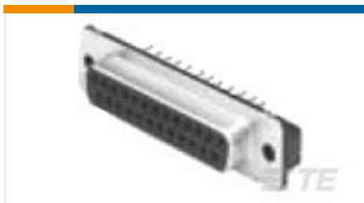
TE 产品编号5747299-8 15 RCPT SP/FMS INSRT