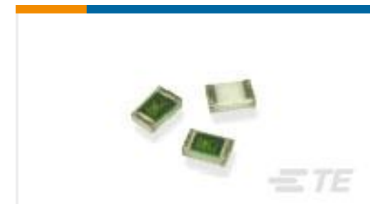
TE 产品编号1614349-9 RN 0603 10K 0.1% 10PPM CUT LENGTH