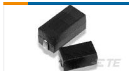
TE 产品编号1-1879234-9 SMF5 3K0 5%