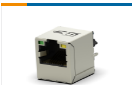
TE 产品编号5-2337993-2 RJ45 JACK MAG. POE 10/100 LED 1X1 VERT.