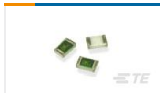
TE 产品编号4-1676971-2 RN 0805 200K 0.1% 10PPM 1K RL