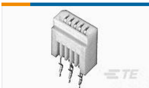
TE 产品编号84984-4 1mm FFC DIP V ASSY 4P NAT(TB)