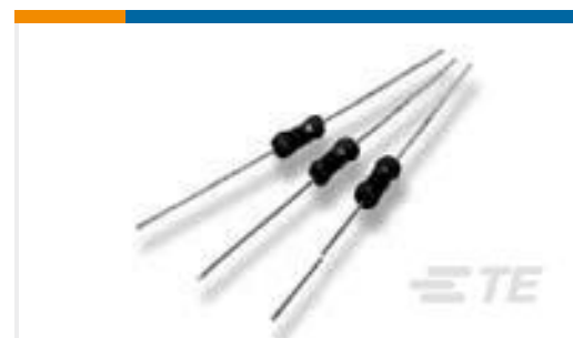
TE 产品编号2-1625885-3 1W SM M/OX 5% 150R