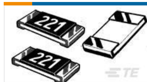
TE 产品编号3-2176231-5 3522 270R 1% 3W