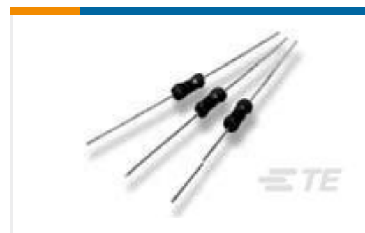
TE 产品编号1879352-2 RR02 5% R36 AMMO