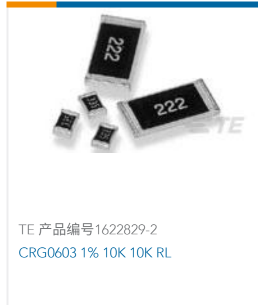
TE 产品编号1622829-2 CRG0603 1% 10K 10K RL