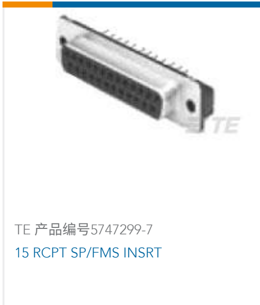
TE 产品编号5747299-7 15 RCPT SP/FMS INSRT