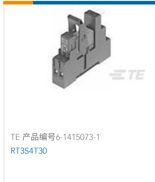
TE 产品编号6-1415073-1 RT3S4T30